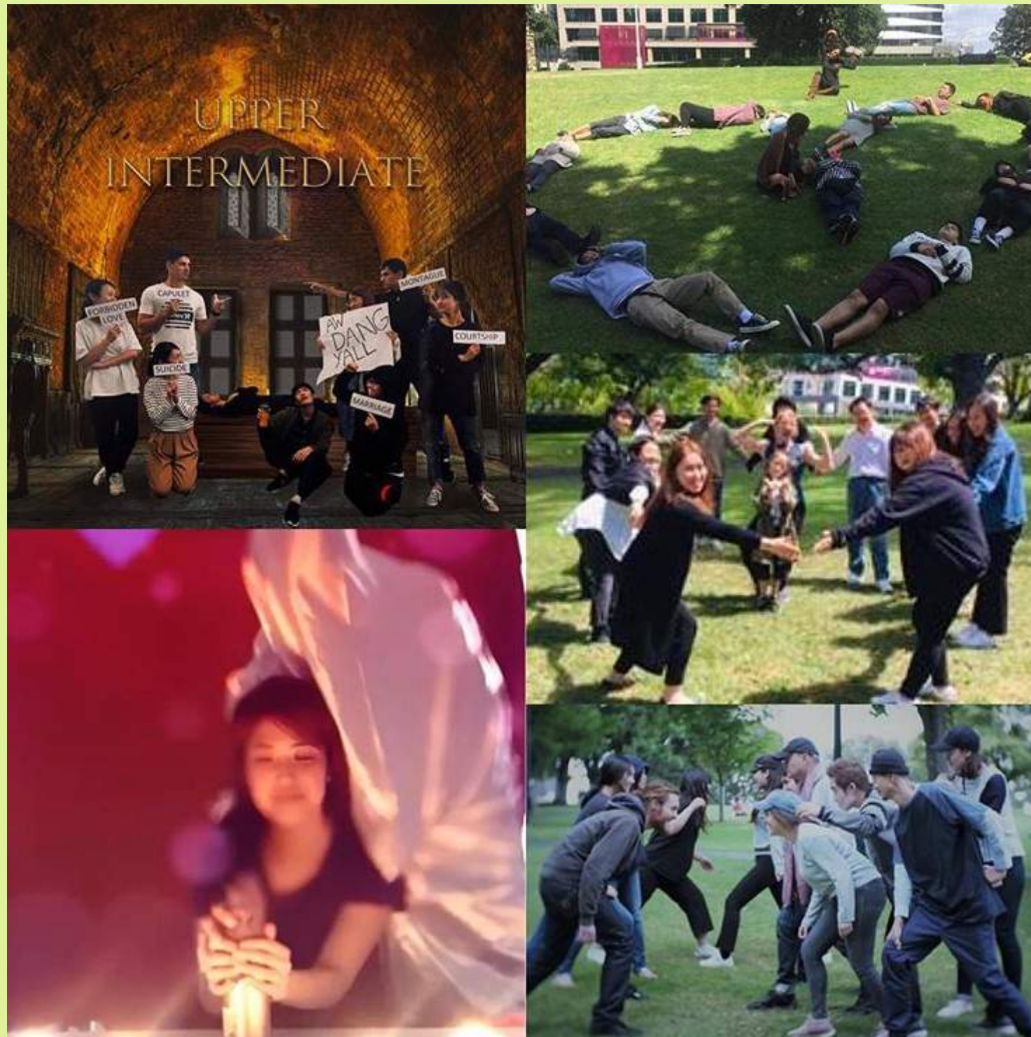
"Representing Love Movies"