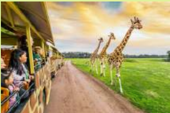
오픈레인지 Zoo (유료)