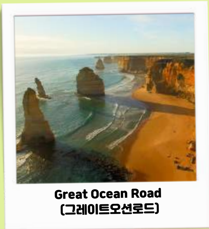
Great Ocean Road (그레이트오션로드)