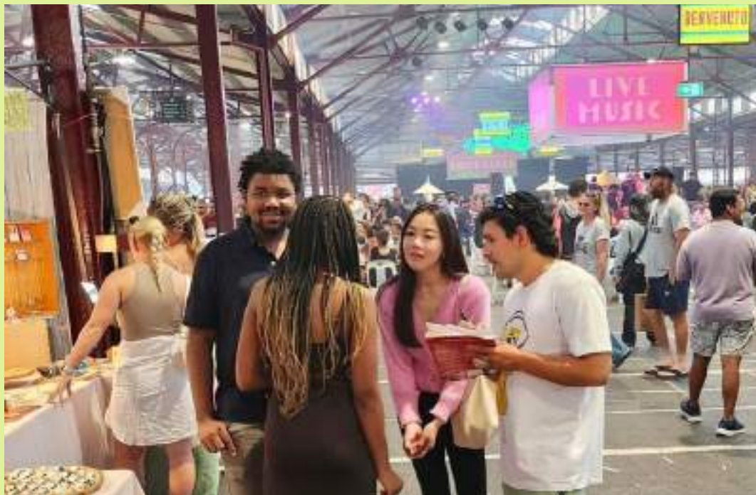
Queen Victoria Market