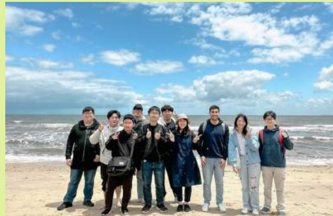
St. Kilda Beach