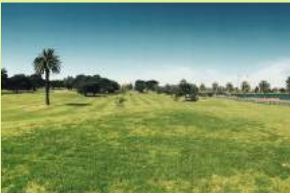
Albert Park 골프 코스