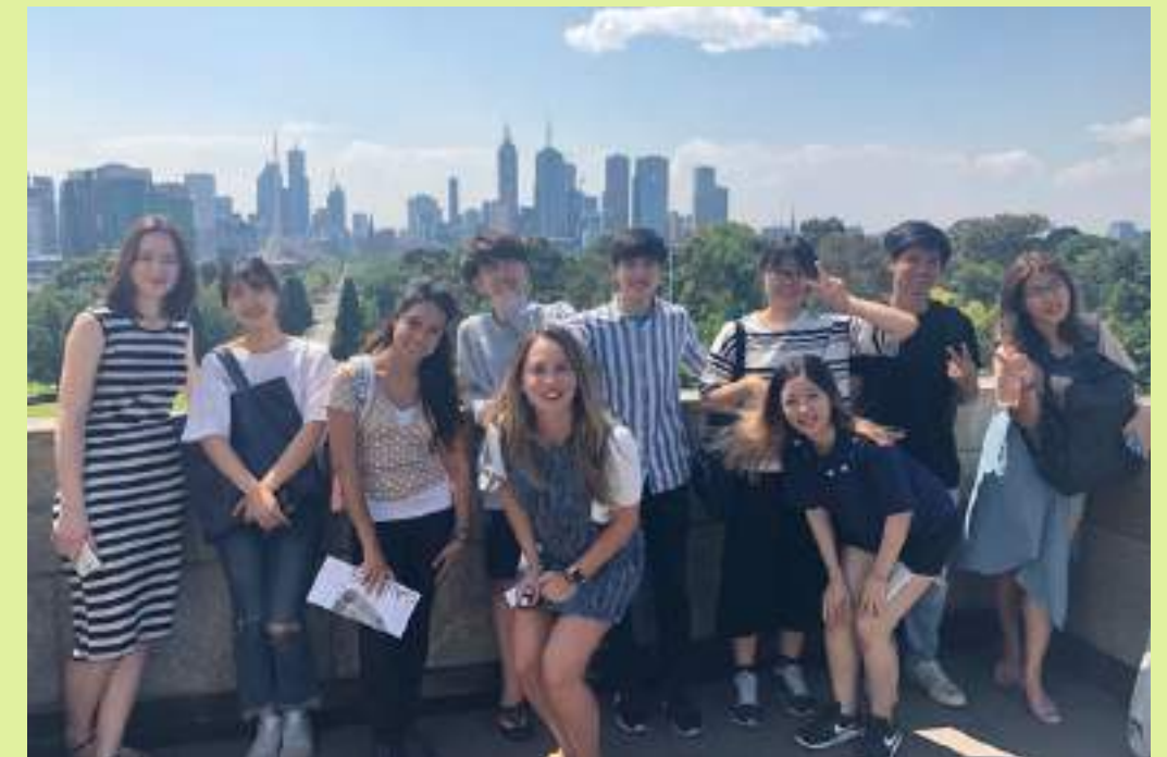
Shrine of Remembrance