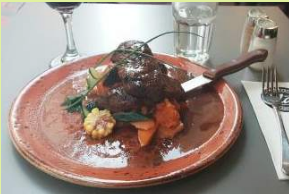
캥거루 스테이크 맛보기