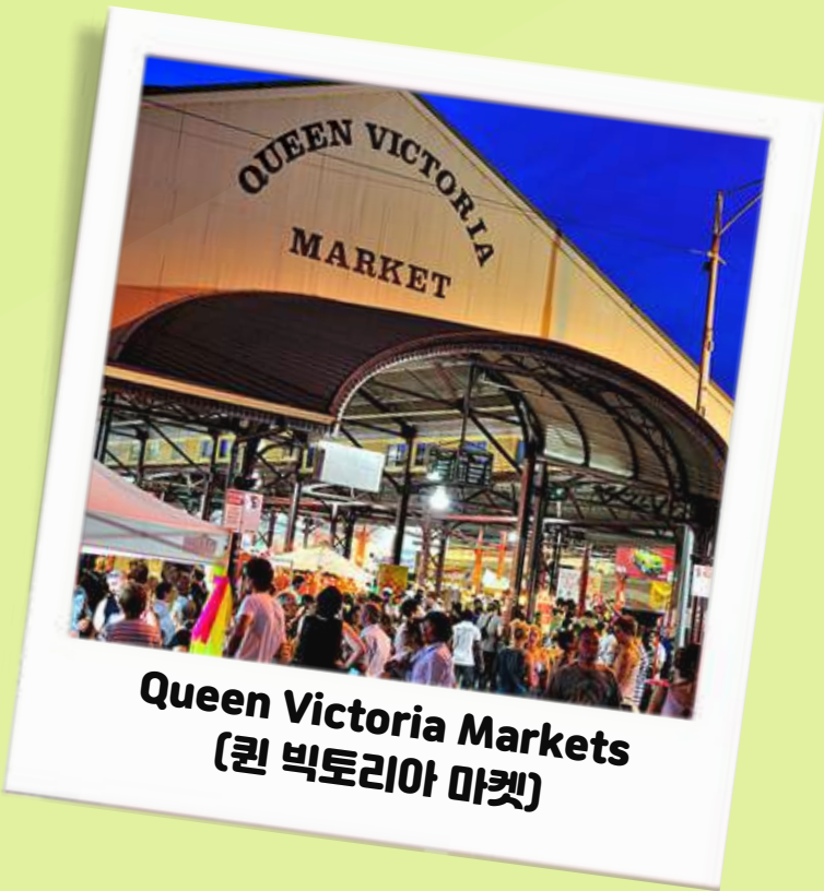
Queen Victoria Markets (퀸 빅토리아 마켓)