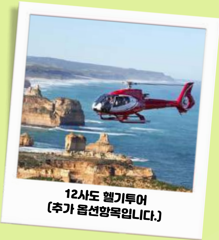
12사도 헬기투어 (추가 옵션항목입니다.)