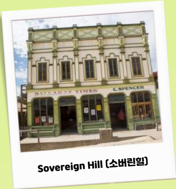
Sovereign Hill (소버린힐)