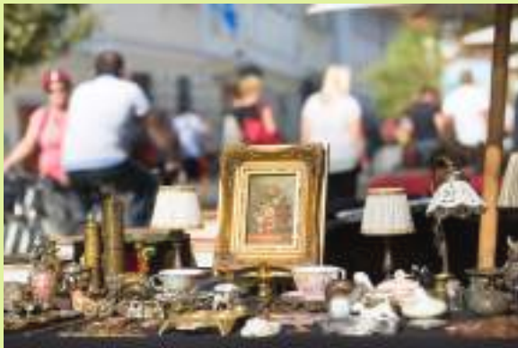
캠버웰 선데이 마켓