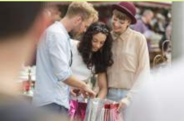
피츠로이 선데이 마켓