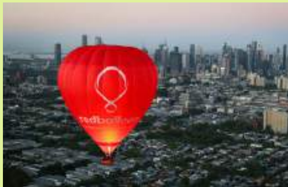
열기구 탑승 (유료)