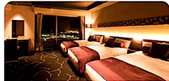
트리플 1,050,000원 1인 기준

① 개별적으로 숙소 선택도 가능하나 2차 일정에 한하여 센다이힐스 호텔에서 우대 가격에 투숙 가능함.