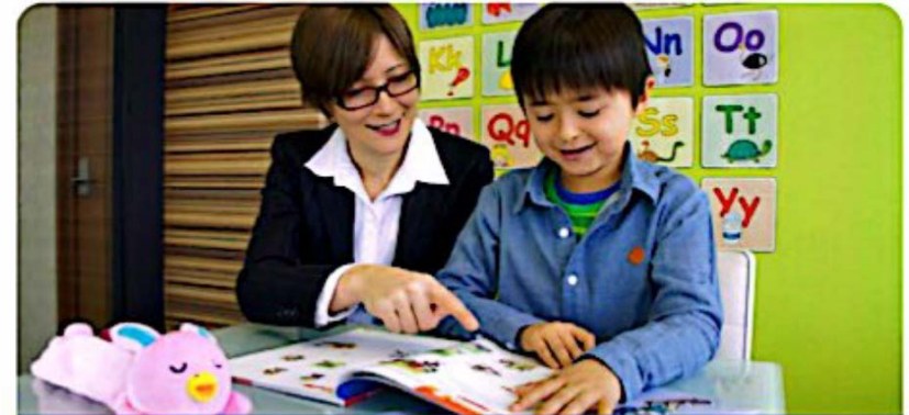
☞ 쾌적한 NOVA 학원 라운지