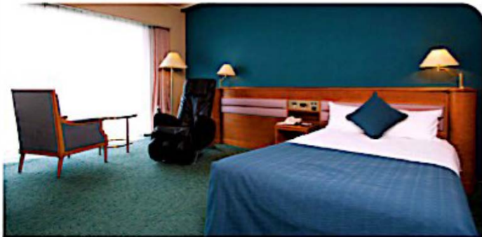
싱글 1,260,000원 1인 기준

8/16(일) ~ 8/29(일) 체크인 총 14박 / 전 일정 조식 포함