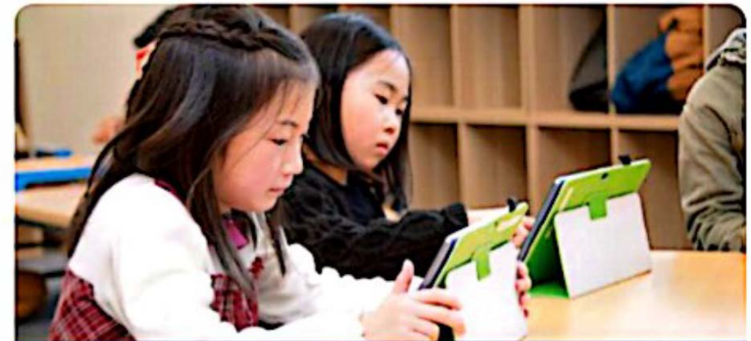
☞ 집중력을 높이는 ASTER 교실