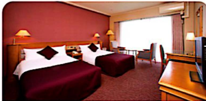
트윈 1,120,000원 1인 기준