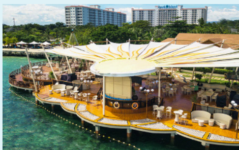
HAVANA BY THE SEA

Sea side Restaurant 전용해변 및 야외데크에서 즐기는 신선한 씨푸드