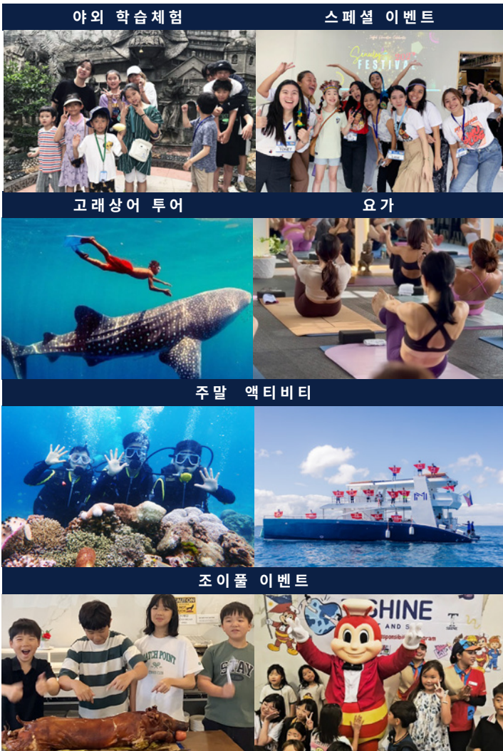
야외 학습 체험